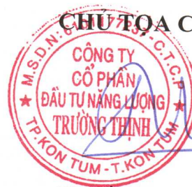
TRẦN QUANG CHUNG